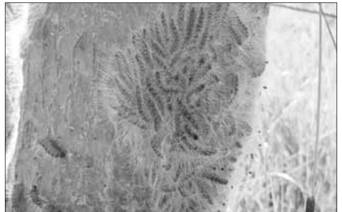
Foto (Benjamin Bailey, aufgenommen in Schöffengrund-Schwalbach, 2018): Milde Winter, langer Sommer: Der Eichenprozessionsspinner findet in den letzten Jahren immer idealere, klimatische Bedingungen, um sich in unserer Region wohlfühlen und anzusiedeln.

Geschäftsanzeigen online buchen: Registrieren Sie sich jetzt unter „meinWittich“ bei www.wittich.de