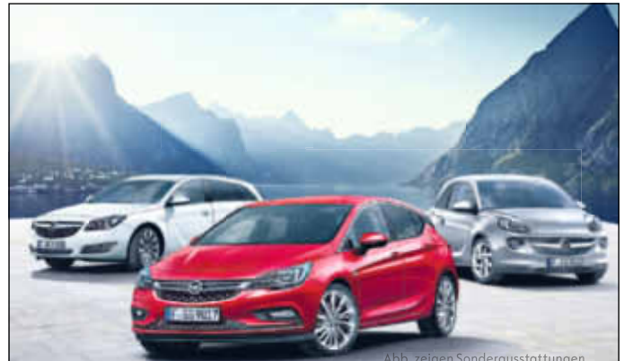
Abb. zeigen Sonderausstattungen.