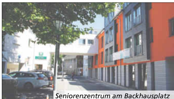
Seniorenzentrum am Backhausplatz

Aus organisatorischen Gründen wird um vorherige Anmeldung gebeten.