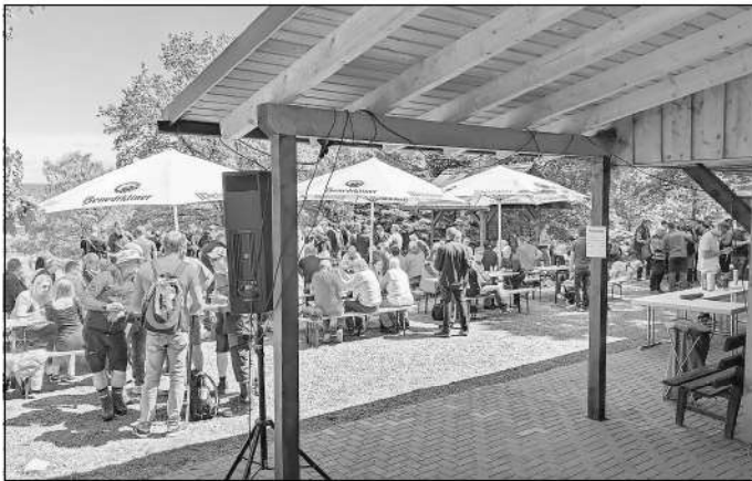
Sommerfest an der Grillhütte Fleisbach