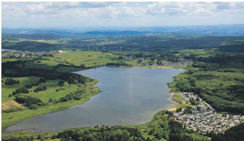
Die Krombachtalsperre ist der höchste Punkt der Rehbachtalkette.

Wer an Wasserkraft denkt, verbindet dies oft mit Skandinavien oder den Alpen mit ihren reißenden Gebirgsflüssen. Doch auch im schönen Westerwald, im hessischen Lahn-Dill-Kreis, wird aus Wasser elektrische Energie gewonnen – hier betreibt der kommunale Energieversorger EAM mit der Rehbachtalkette fünf kleine Wasserkraftwerke. 17 Kilometer schlängelt sich der Rehbach, ein Zufluss der Dill, von der Krombachtalsperre abwärts ins Dilltal. Bereits vor fast 100 Jahren leistete der Privatunternehmer Emil Wilhelm Langenbach im Rehbachtal auf dem Gebiet der Wasserkraftnutzung Pionierarbeit. 1924 erzeugte er in dem von ihm erbauten Wasserkraftwerk Guntersdorf den für sein Kleineisenwerk benötigten Strom selbst. In Zeiten der Energiewende war er mit diesem Konzept seiner Zeit offensichtlich weit voraus. Wenn aber der Rehbach im Sommer wenig Wasser führte, reichte die von seinem Kraftwerk erbrachte Leistung nicht aus. Er musste von der damaligen Hessen-Nassauischen Überlandzentrale Oberschedl Strom hinzukaufen, die 1925 das Kraftwerk in Guntersdorf übernahm und die Wasserkraftnutzung im Rehbach weiter ausbaute.