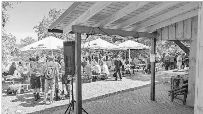
Sommerfest an der Grillhütte Fleisbach