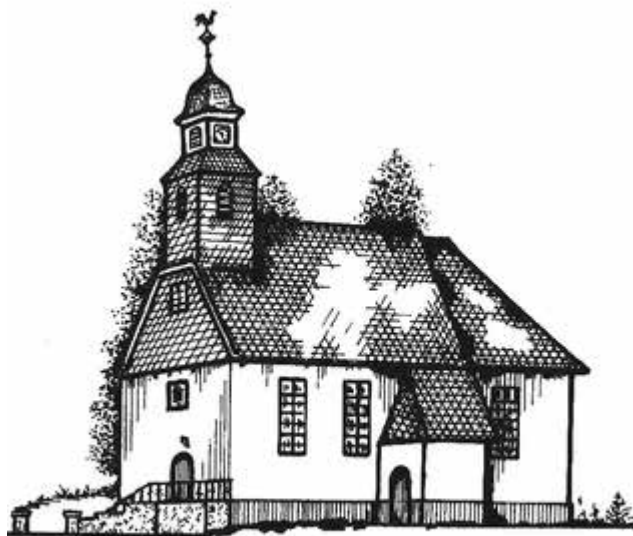
ev. Kirche - Edingen

Im Namen der Gemeindevertretung und des Gemeindevorstandes gratulieren wir den Konfirmandinnen und Konfirmanden des Ortsteiles Edingen und wünschen ihnen für ihren weiteren Lebensweg alles Gute.