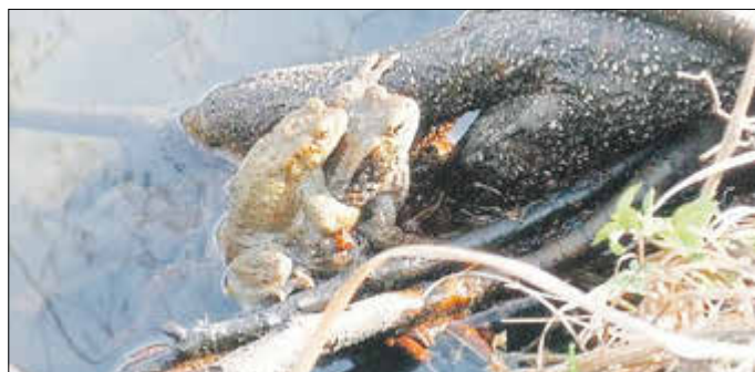
Krötenpärchen im Lennelbach

Kröte: rundlich massiver Körperbau, größer als Frösche, kurze Beine, kriechende, krabbelnde Fortbewegung, runde Schnauze, keine Schwimmhäute zwischen den Zehen, faltig trockene, ledrige Haut mit Warzen und Unebenheiten, Lebensraum auch weiter entfernt von Gewässern, schnurförmiger Laich.