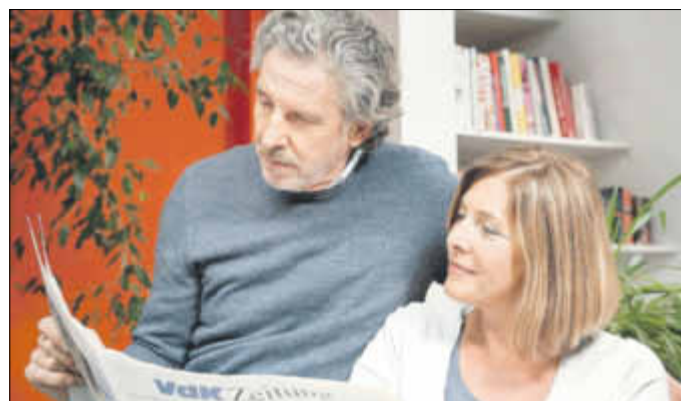
Ein Nachbar liest einem behinderten Menschen aus der Zeitung vor

Gute Nachricht für Pflegebedürftige in Hessen: Tätigkeiten von Nachbarschaftshelfern und -helferinnen ohne behördliche Qualifizierung können noch bis 30. Juni 2022 über den Entlastungsbetrag von monatlich 125 Euro abgerechnet werden. Seit dem Ausbruch der Corona -Pandemie kann die sogenannte Nachbarschaftshilfe in der häuslichen Pflege erfolgen, ohne dass hierfür eine entsprechende Qualifizierung und behördliche Zulassung erfolgte. Die Tätigkeit der Nachbarschaftshelfer und -helferinnen kann seitdem über den Entlastungsbetrag in Höhe von 125 Euro pro Monat, der jedem Pflegebedürftigen ab dem ersten Pflegegrad zusteht, abgerechnet werden. Ursprünglich galt diese Übergangsregelung bis zum 31. Dezember 2021. Diese Frist wurde jetzt verlängert.