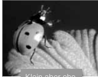
Klein aber oho

LINUS WITTICH Lokal informiert. Druck. Internet. Mobil.